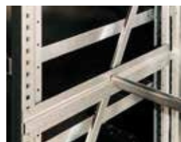
Percha para ropa